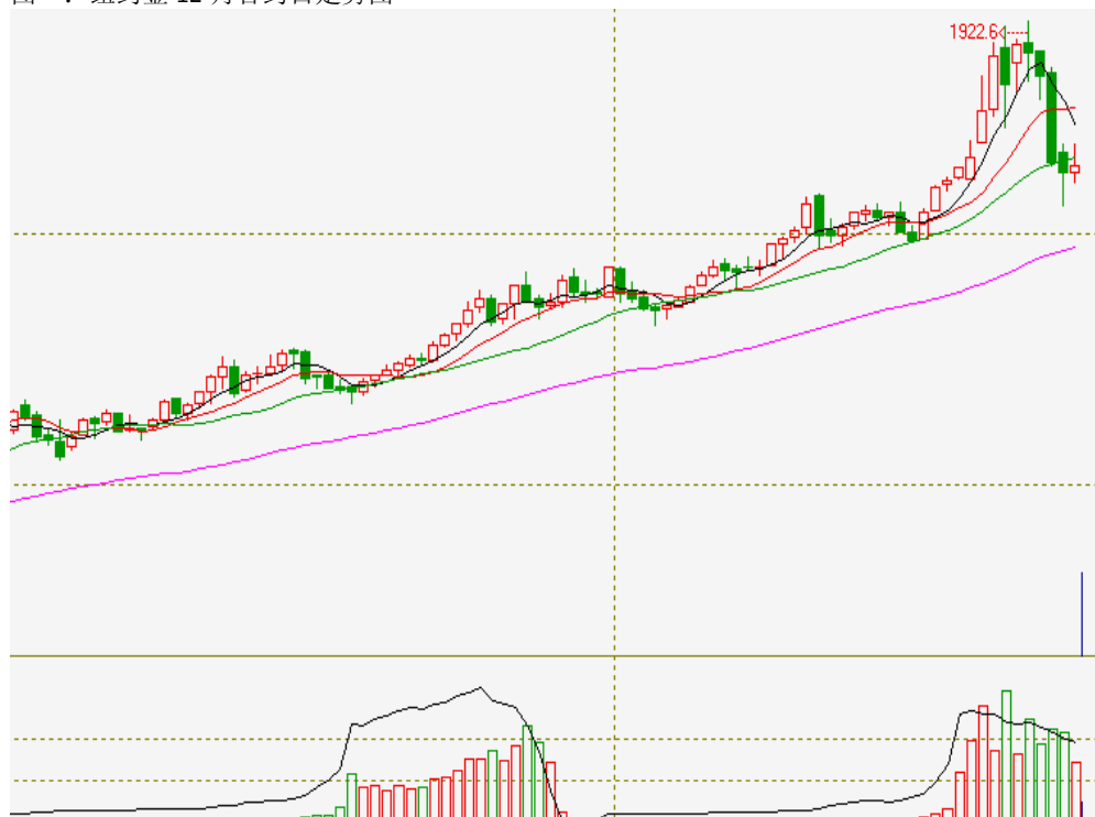
图二：纽约金 12 月合约周线图