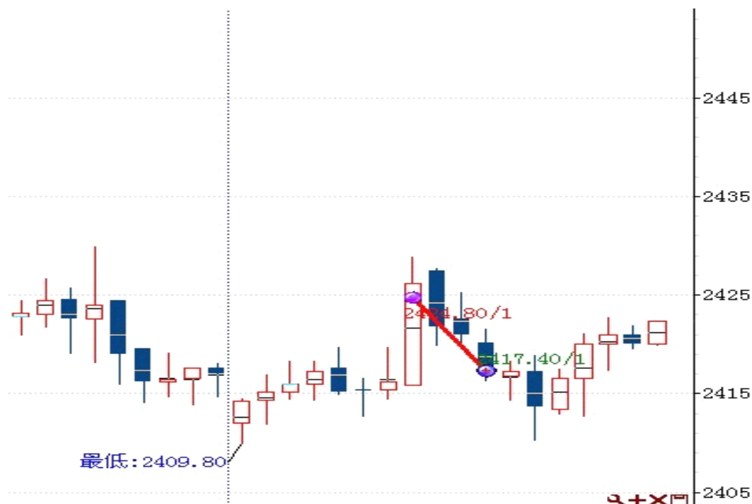
图表 2: 交易情况