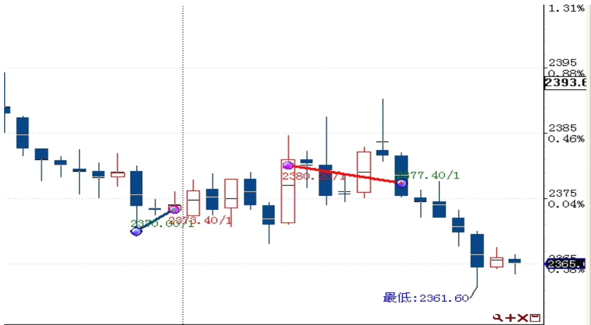
图表 2: 交易情况