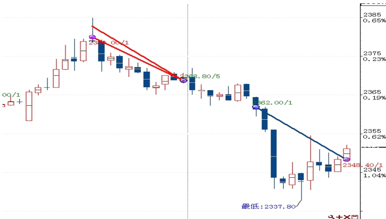
图表 2: 交易情况