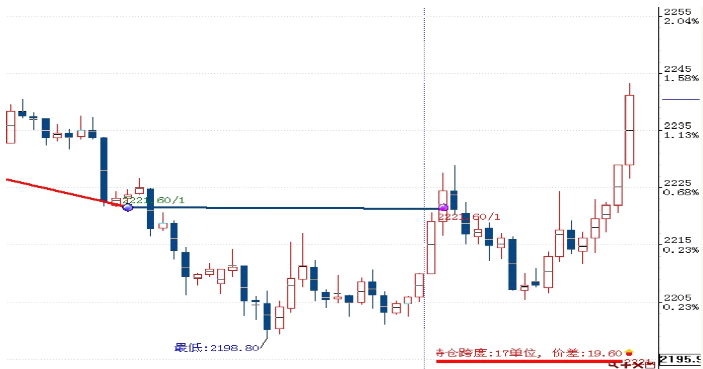
图表 2: 交易情况