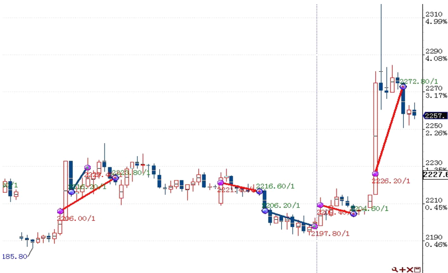
图表 1: 交易痕迹

初始资金 100 万, 起始日期: 2012年5月8日 截止 2012年9月27日, 总权益: 1011449元