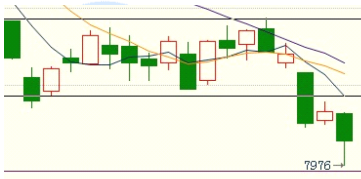
连豆油 9 月合约周线箱体破位寻底

技术说明：周线箱体下破后，空头目标至于 7550 附近，而后涌现获利盘，期价出现超跌反弹。