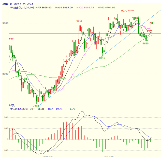
图3 LLDPE1701 合约日线图

阳线、周五窄幅震荡收出小阴线，最终周线收出下影线较长，实体较长的中阳线。均线方面，周二时大幅走高站上5日均线，周三时走高站上20日均线，周五时5日均线上穿10日均线。周线上，5周均线拐头向下，但10、20周均线继续走高，至收盘站在5、10周均线之上。