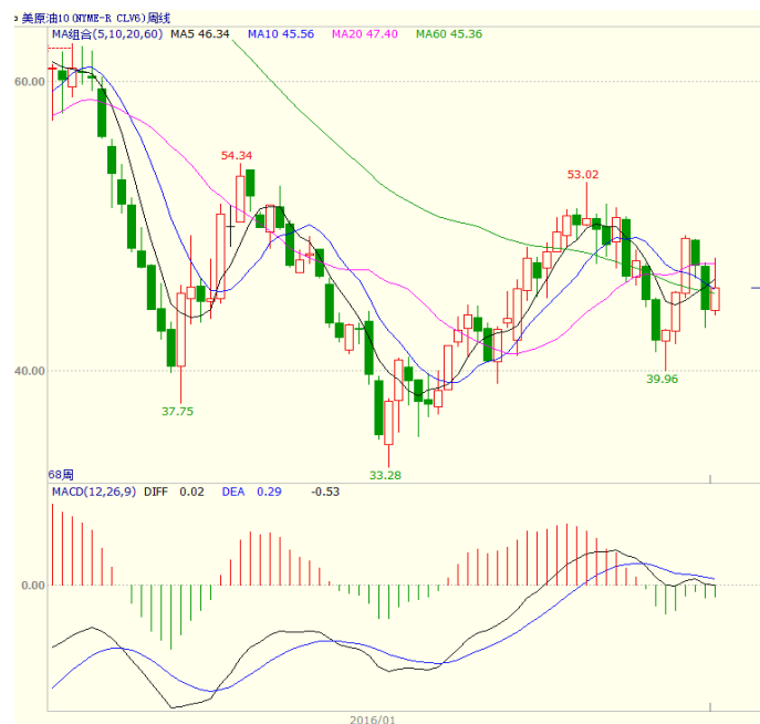
图1 美原油主力合约周线图

本周美国能源信息署(EIA)公布的数据显示,截至9月2日当周,美国EIA原油库存大幅下降1451万桶,至5.1136亿桶;美国汽油库存下降421万桶,至2.2779亿桶;备受市场关注的库欣地区原油库存减少43.4万桶,至6343.3万桶。美国油服贝克休斯公布的数据显示,截至2016年8月26日当周美国石油活跃钻井数增加7座至414座,过去11周内第10周录得增加。至收盘美原油周K线收盘上涨3.42%,收出带长上影的阳线,上方5日均线承压,短线走势震荡。