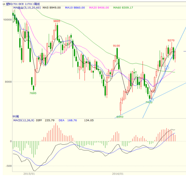
图 4 LLDPE1701 合约周线图