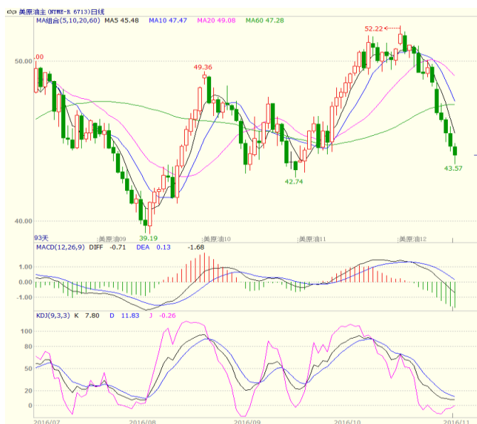
图1 美原油主力合约周线图

本周美国能源信息署(EIA)公布的数据显示,截至10月28日当周,美国EIA原油库存增加1442万桶,至4.8258亿桶;库欣地区原油库存5845万桶,增加了8.9万桶。美国油服贝克休斯公布的数据显示,截至2016年11月04日当周美国石油活跃钻井数增加9座至450座,触及2月份以来最高水平,过去23周内,有20周录得增加。近期,市场对欧佩克能否真正执行限产的担忧增加,使得油价承压。至收盘美原油周K线收盘下跌1.35%,收出中阴线,跌破10周均线支撑,短线震荡偏弱走势。