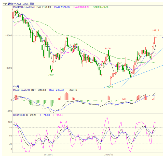
图 4 LLDPE1701 合约周线图