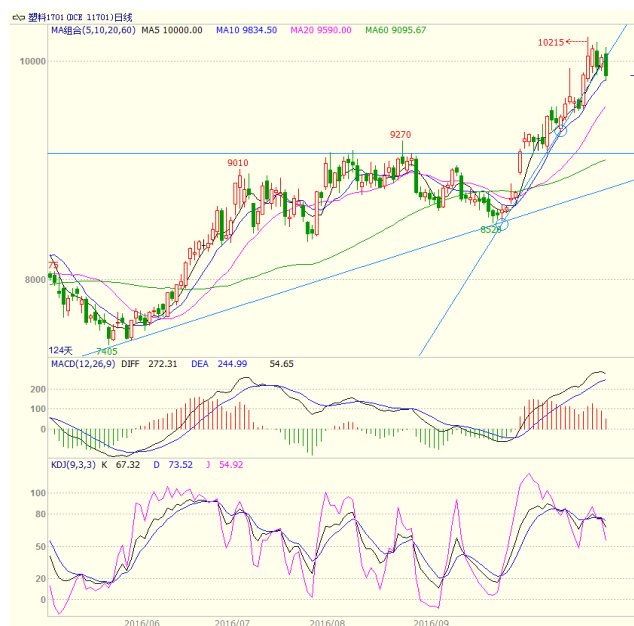
图3 LLDPE1701 合约日线图

中阳线、周三走低收出中阴线，周四收出小阳线，周五高开低走收出中阴线。最终周线带长上影的小阳线。均线方面，下方10、20日均线形成支撑，周线上，5、10、20周均线多头排列，且本周继续向上，下方5周均线处支撑较强。