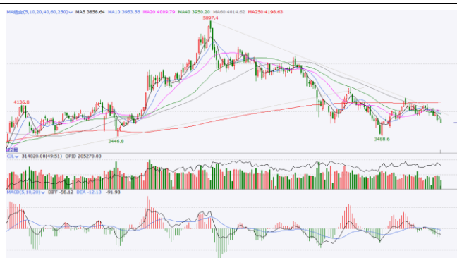
图 5. IF 加权周 K 线图

周线方面，IF加权跌沿5周线向下运行，成交量和持仓量下降，周线级别下跌趋势已经形成。短期关注3700整数关口支撑，若被有效跌破则将继续寻底。