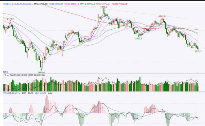
图 5. IF 加权日 K 线图

日线方面，IF 加权在 10 日线附近承压回落，短线反弹后继续下跌，再创年内新低，技术上进入波段寻底阶段，短期关注 3700-3750 一线支撑。