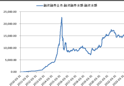
图2. 沪深两市融资余额(亿元)