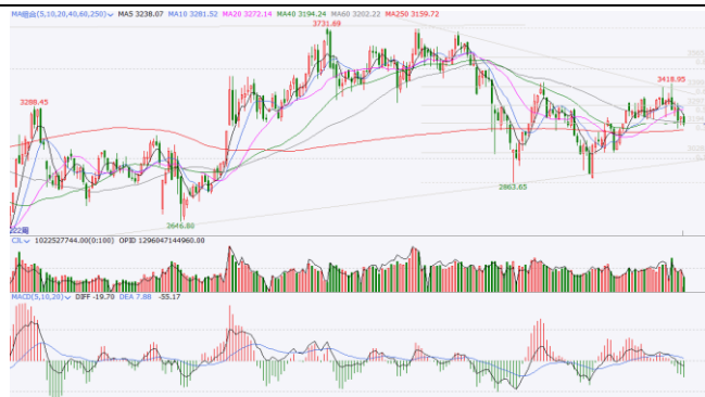
图 6. 上证指数周 K 线图