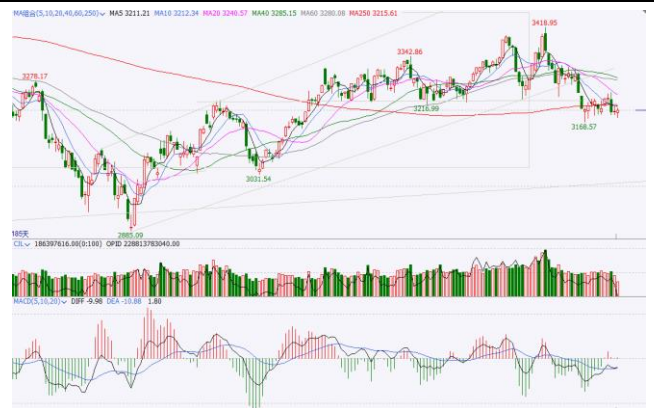
图 6. 上证指数日 K 线图