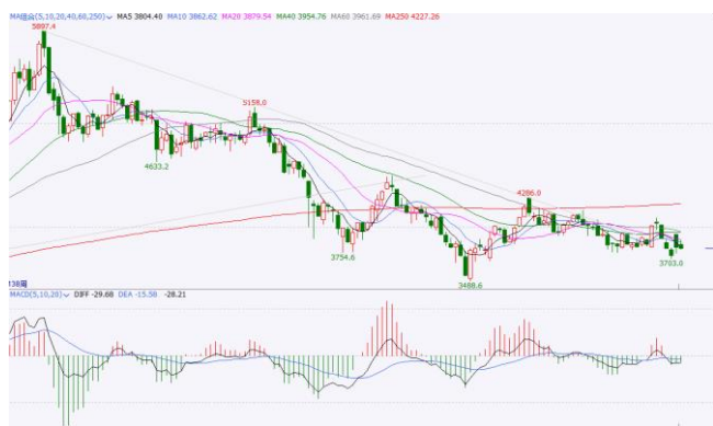
图 5. IF 加权周 K 线图

周线方面，IF 加权反弹受到 20 周线的压制，成交量和持仓量下降，短期或考验前期低点 3700 关口支撑，若被有效跌破需防范再次探底风险。