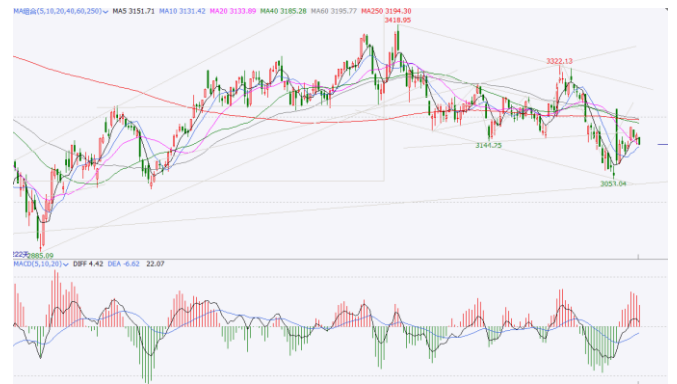
图 6. 上证指数日 K 线图