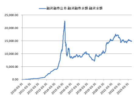
图 2. 沪深两市融资余额（亿元）