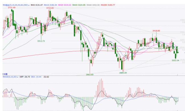
图 6. 上证指数周 K 线图