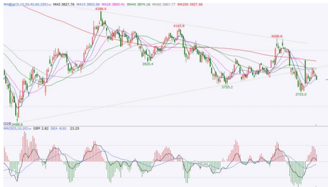
图 5. IF 加权日 K 线图

日线方面，IF 加权反抽 40 日线承压回落，跌破 5、10 日线，短期或再次进入调整。关注前期低点 3700 关口一线支撑，若被有效跌破需防范调整加深风险。